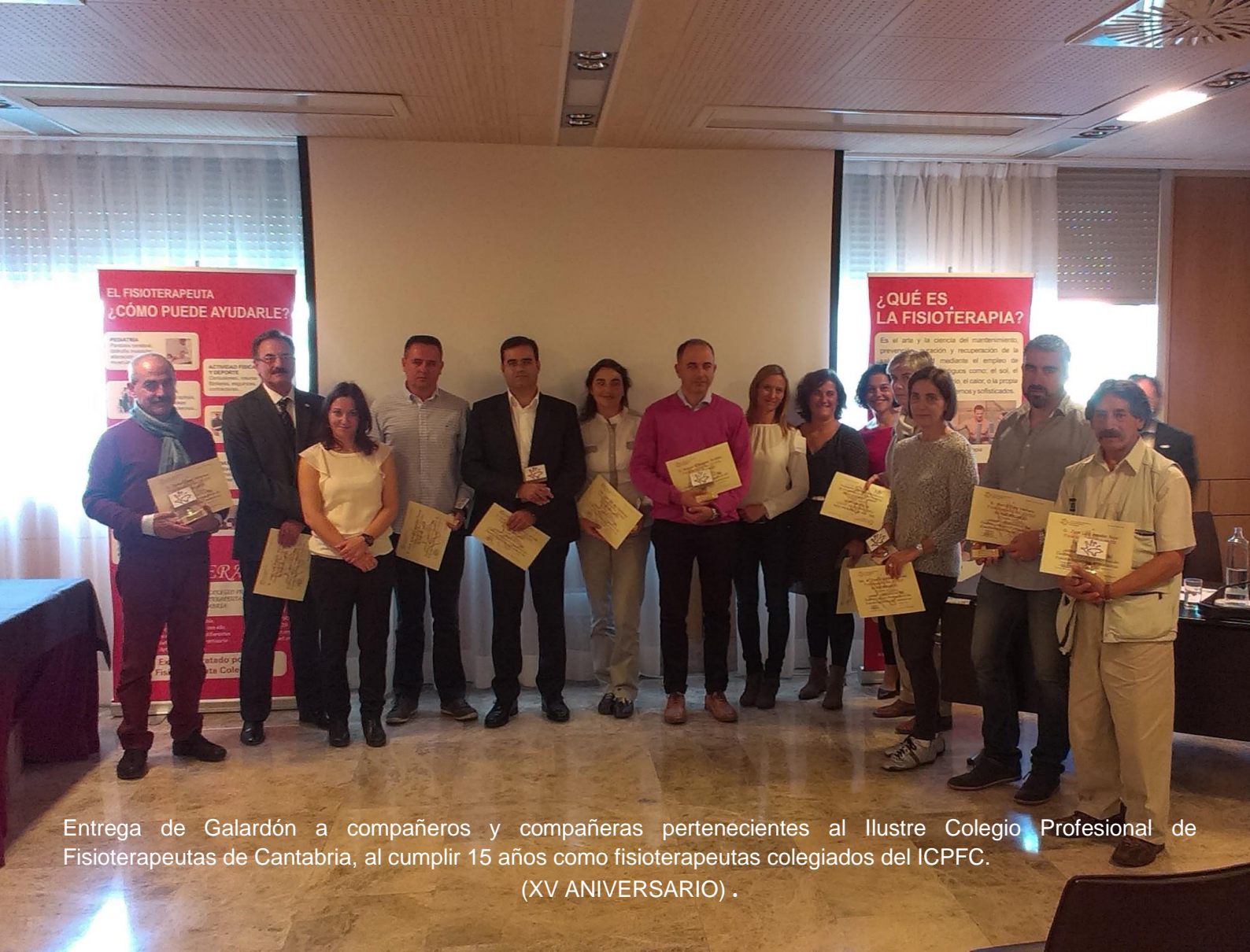
Entrega de Galardón a compañeros y compañeras pertenecientes al Ilustre Colegio Profesional de Fisioterapeutas de Cantabria, al cumplir 15 años como fisioterapeutas colegiados del ICPFC. (XV ANIVERSARIO) .